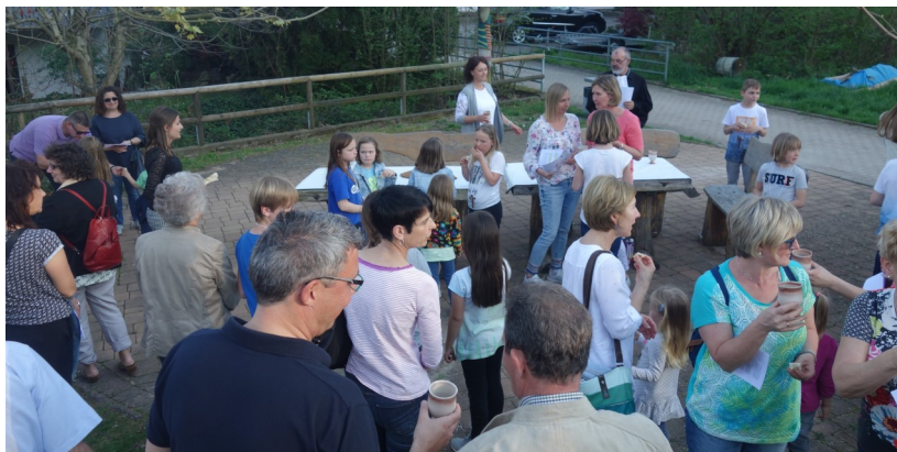
Erinnerung an Jesu erstes Abendmahl