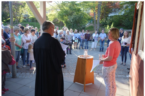
Erinnerung an Jesu Taufe

Der Ostersonntag sgottesdienst hat das nochmals bestätigt und vertieft: Wir vertrauen unserem Vater im Himmel um Jesu Willen, dass das Leben von Gott den Tod verschlingt, wie das Licht die Finsternis verjagt.