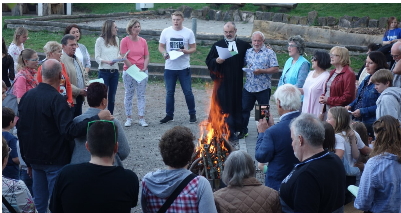
Erinnerung an Jesu Auferstehung